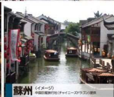
蘇州 (イメージ)