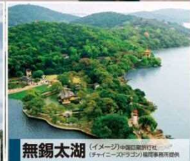
無錫太湖 (イメージ)